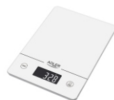
KITCHEN SCALE AD 3170