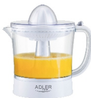
CITRUS JUICER AD 4009