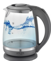
ELECTRIC KETTLE AD 1286